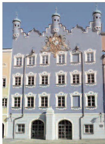
Stadtsaal, där festligheterna ska äga rum.