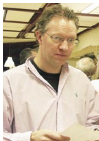
– Hängde du med i svängarna?