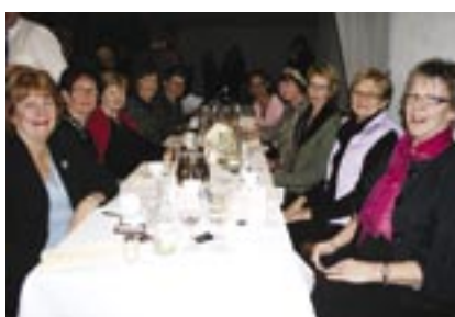
10 glada damer från Västerås.

➤ allsånger från Evert Taubes digra skatt. Rosa på bal, Dansen på Sunnanö och Flickan i Havanna sjöngs för fulla halsar. Till femårsjubileet lovar trion Hasse & Tage-tema och trion bjöd på ett smakprov redan i år.