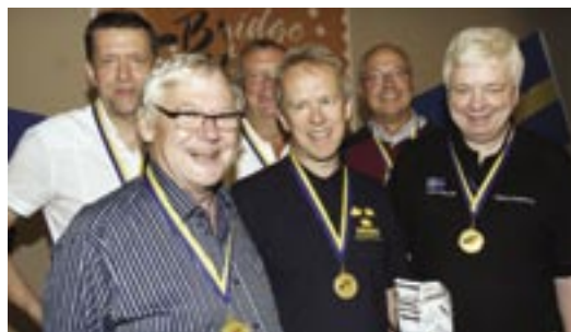
– Vinnarlaget 2009 –