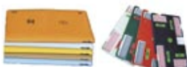
MJUK- OCH HÅRDPLASTBRICKOR