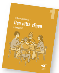
DEN RÄTTA VÄGEN - DEL 1 AV 5