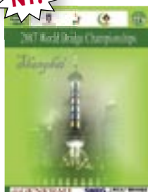
VM-BOK - SHANGHAI 2007