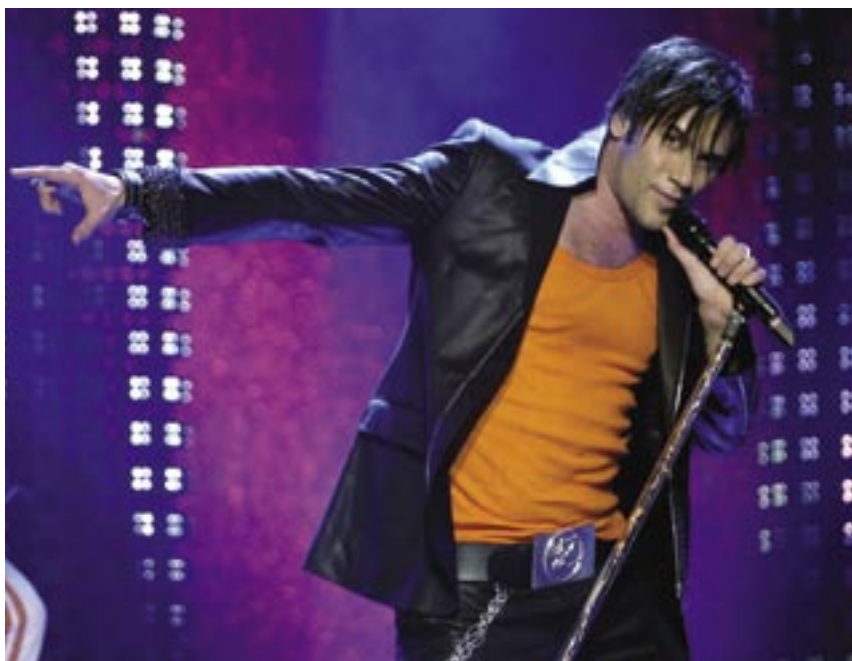
Martin Stenmarck.