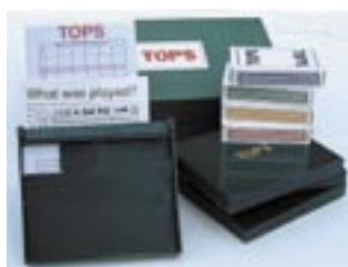
TOPS - GRUNDSET