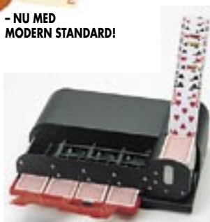
BRICKLÄGGNINGSMASKIN - DUPLIMATE