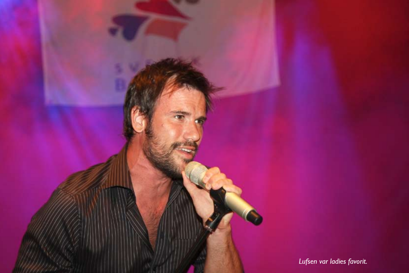
Lufsen var ladies favorit.