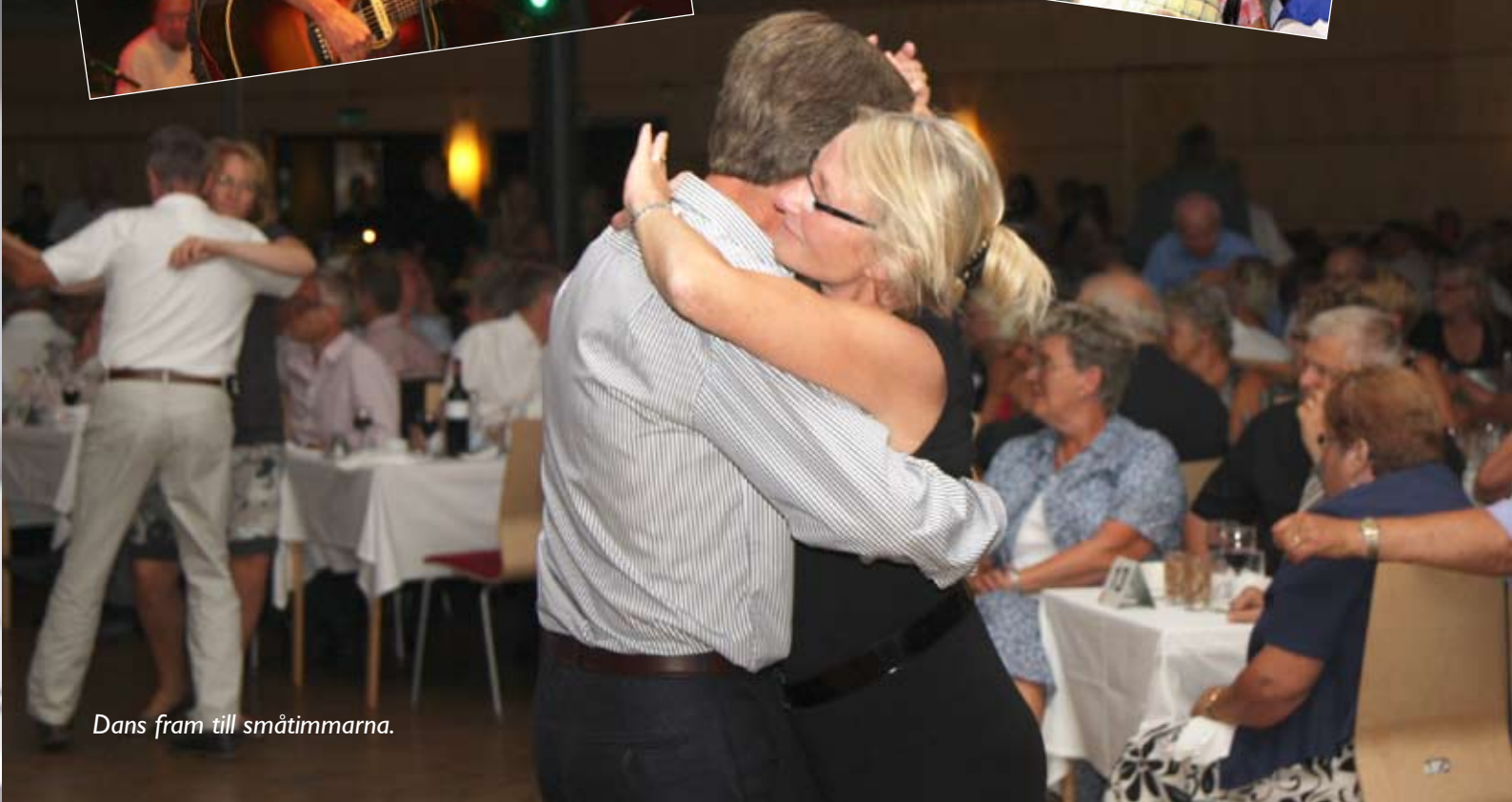
Dans fram till småtimmarna.