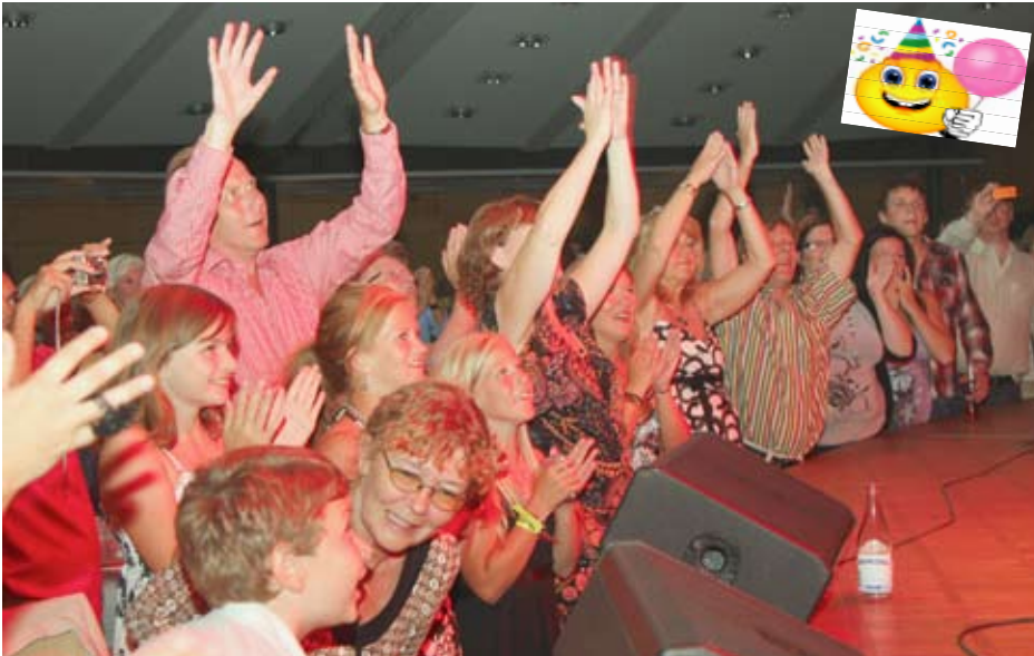
Det var högtryck i Conventum när Martin Stenmarck rockade loss på scenen.