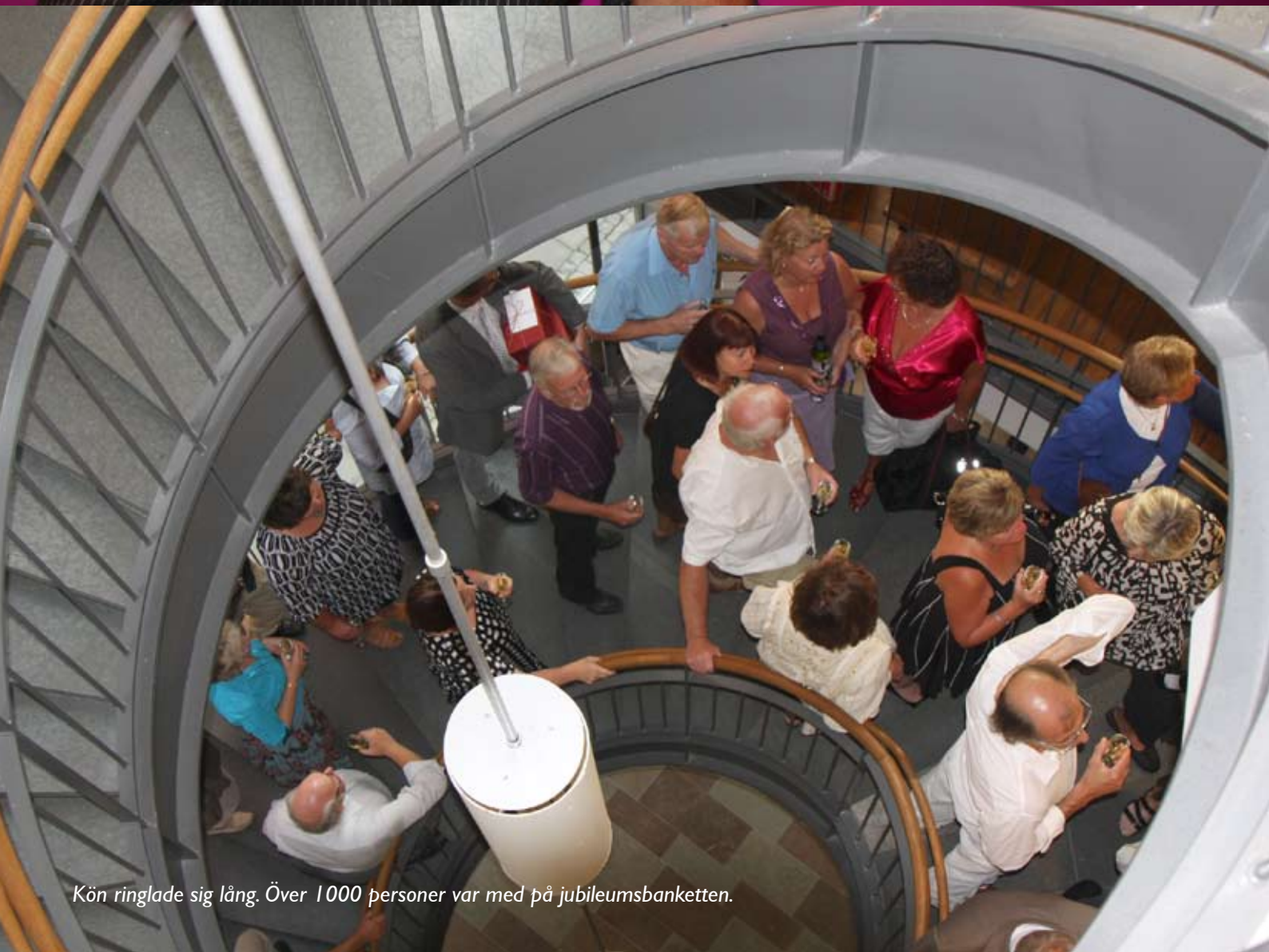
Kön ringlade sig lång. Över 1000 personer var med på jubileumsbanketten.